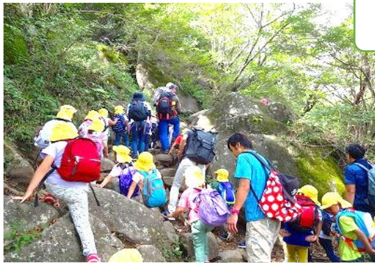
9/17 筑波山登山 途中で食べるおむすびの味は格別！ さあ、元気が出たよ。頂上目指して頑張るぞー