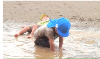
泥んこの上に寝ころんだ感触を 大人になっても忘れないでね