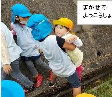
まかせて！ よっこらしょ