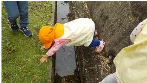
あ〜ん、わたれな〜い という2歳児続出…さあどーする！