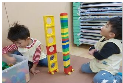
すごい！ 積載オーバーかな？